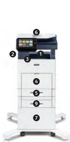
Xerox® VersaLink® B615 multifunktions skrivare Skriv ut. Kopiera. Skanna. Faxa. Skicka e-post.